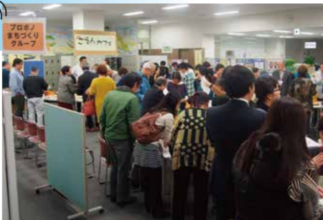
会場内で、「セルフきたかせ」「おかし工房しいの実」による、パン・お菓子などの販売があります。