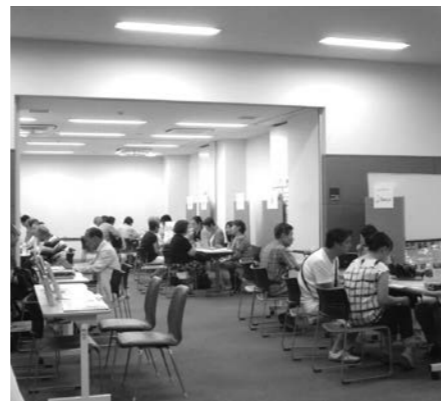
《出展企業・団体(順不同)》(株)プロップビジネスコンサルティング、(株)リリー、サイボウズ(株)、NPO法人ジービーパートナーズ、(株)ソノリテ、(株)PubliCo、NPO法人日本NPOセンター、(株)シン・ファンドレイジングパートナーズ、NPO法人CRファクトリー、(株)カルミナ

今後も、定期的にこのような出会いの機会を設けたいと考えています。次回はぜひ、皆様のご参加をお待ちしています。