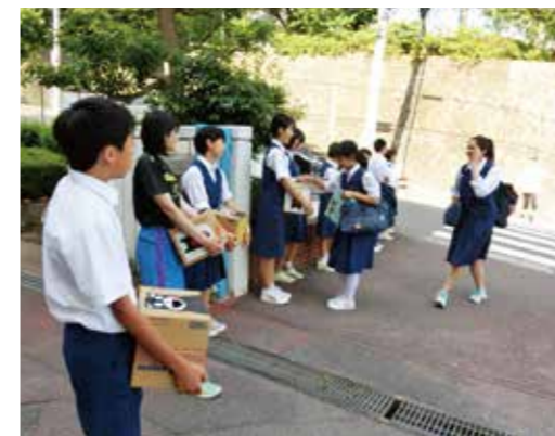
▲募金を呼びかける枞形中学校福祉委員会のみなさん

かわさき市民活動センターでは、「平成28年熊本地震」による被災地の復興支援に向け、「熊本地震復興支援ボランティア活動募金」を募っております。当センターに募金箱を設置しておりますほか、預金口座も開設しております。