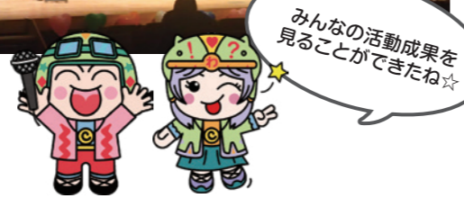
※こぶんたは、当財団が管理運営するこども文化センター52館のキャラクターです。 ※わくりんは、当財団が管理運営するわくわくプラザのイメージキャラクターです。