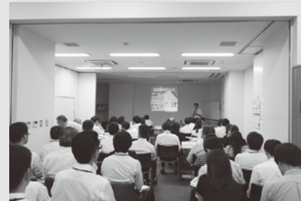
事例紹介風景(第1回)

第1回目は情報共有の事例紹介のあと、各区に分かれて、情報をどのように共有できるかを話し合いました。第2回目は、それぞれが持つ情報を出しあい、どのような場面で共有して活用できるか、それで得られる効果を考えました。最後に話した内容を発表、共有しました。