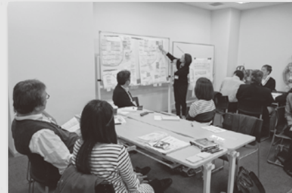
各区の発表風景(第2回)