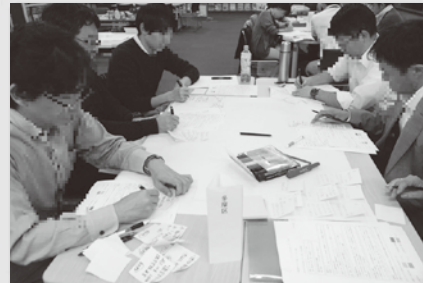
各区でワーク(第2回)